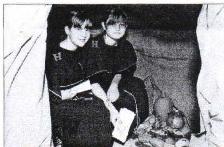
Destrniška turistična stojnica je bila nekaj posebnega, skoraj sničen prikaz antične gomile.