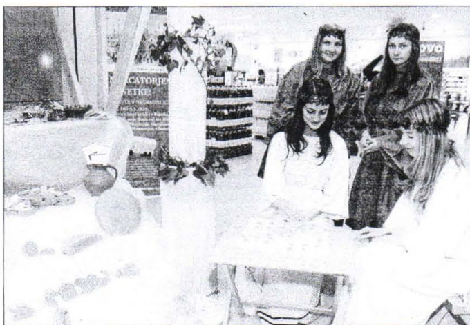
Učenci turističnega krožka OŠ Ljudski vrt so zlato priznanje prejeli za raziskovalno nalogo z naslovom Rimska opekarska peč – nit preteklosti, sedanjosti in prihodnosti.